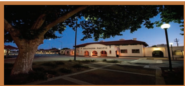
Modesto Bus/Train Depot

La Jurisdicción de Vehículos Abandonados (AVA) designada por la Mesa de Supervisores del Condado Stanislaus, en cumplimiento al Código del Tránsito de California, Sección 22710(a)